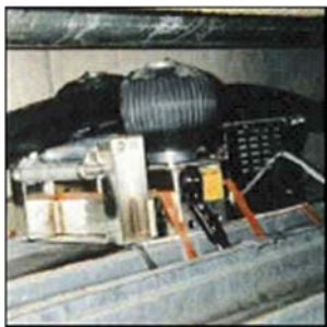
ケーブル牽引作業例