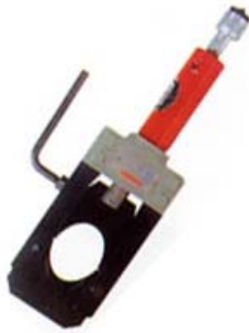
REC-50B 保有 2台